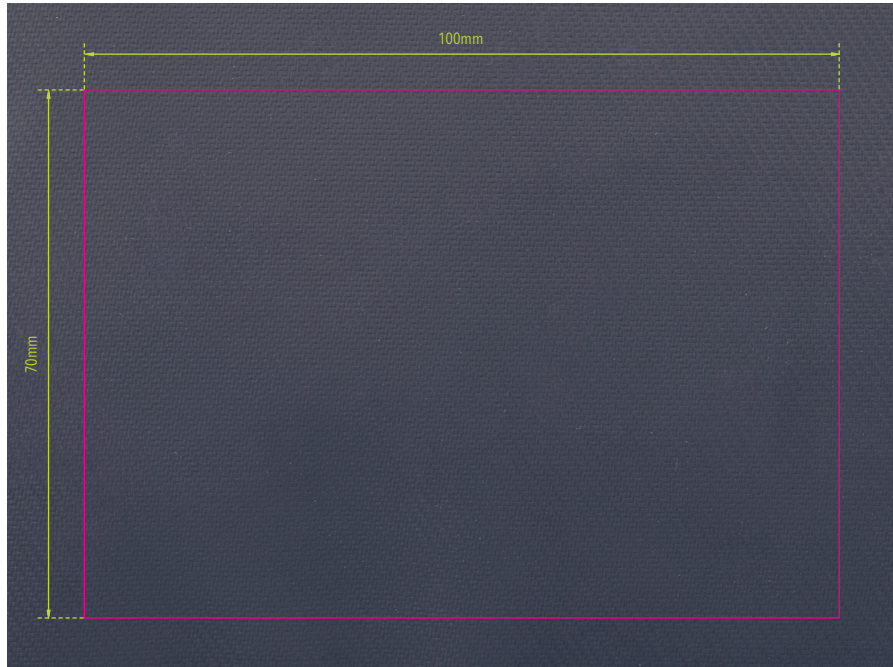
Abbildung oben 1:1

Gestaltungsvorlage für Werbeanbringung auf BBL70/BK , „TROIKA BLACK BUSINESS CARRY 2“