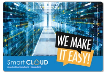
Ansicht des fertigen GripCleaner®